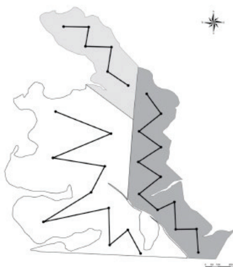
Figura 4: Percurso em “zig-zag” para coleta de subamostras em 3 áreas distintas de uma propriedade