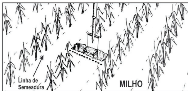
Figura 3: Demonstração de coleta de subamostras na entrelinha da cultura com adubação na linha de semeadura com utilização de pá de corte ou trado